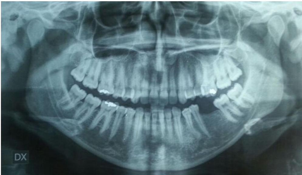
Fig. 2 Ortopantomografia