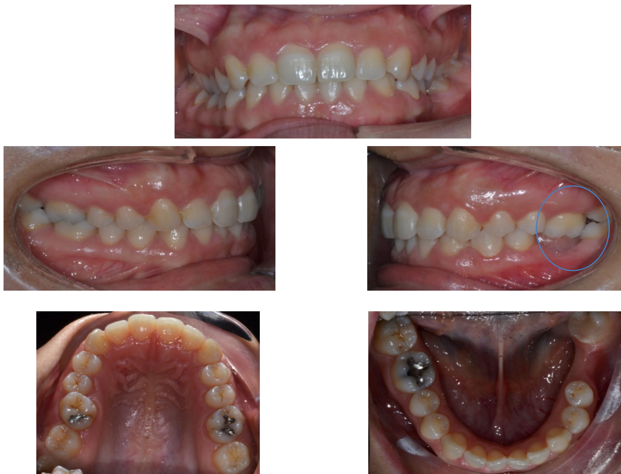
Fig.1 Foto intraorali

Alla visione sagittale sinistra notiamo la notevole estrusione dell'elemento 2.6, dovuta all'assenza dell'elemento dentario antagonista (Fig.1).