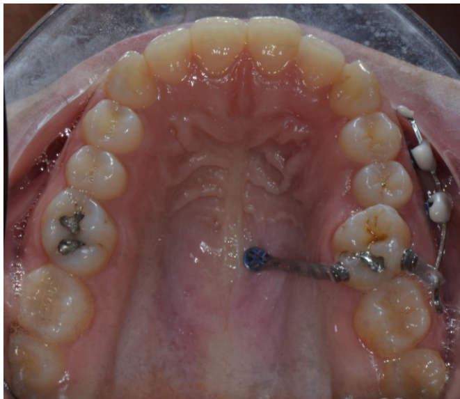
Fig. 4 Minivite palatale

La minivite palatale è stata posizionata a 2 mm dalla sutura mediana a livello della linea intermolare e collegata tramite una catenella elastica al bottone palatale bondato sulla superficie palatale del 2.6.