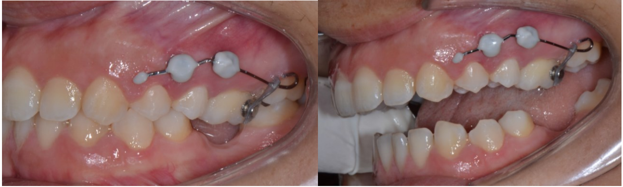
Fig. 3 Miniviti vestibolari con leva di intrusione

La minivite palatale è stata posizionata a 2 mm dalla sutura mediana a livello della linea intermolare e collegata tramite una catenella elastica al bottone palatale bondato sulla superficie palatale del 2.6.